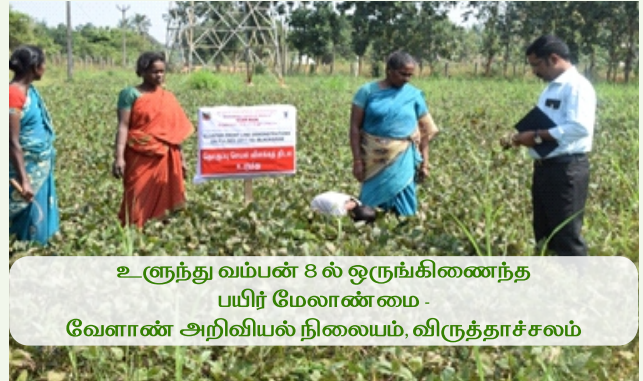
உளுந்து வம்பன் 8 ல் ஒருங்கிணைந்த பயிர் மேலாண்மை - வேளாண் அறிவியல் நிலையம், விருத்தாச்சலம்

வேளாண் சார்ந்த தொழில்களான காளான் வளர்ப்பு, கோழி வளர்ப்பு, விதை உற்பத்தி, நர்சரி மேலாண்மை, மாடு வளர்ப்பு, ஆடு வளர்ப்பு, பட்டுப்புழு வளர்ப்பு, உயிரியல் காரணிகள் உற்பத்தி, மண்புழு உரம் தயாரிப்பு, தேனீ வளர்ப்பு, மீன் வளர்ப்பு, பண்ணை இயந்திரமயமாக்குதல், துல்லியப் பண்ணையம், வேளாண் பயிர்களில் மதிப்பூட்டப்பட்ட பொருட்கள் தயாரித்தல் மற்றும் அதனைச் சார்ந்த தொழில்களில்