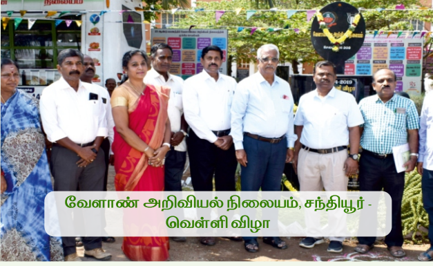
வேளாண் அறிவியல் நிலையம், சந்தியூர் - வெள்ளி விழா

வேளாண் அறிவியல் நிலையங்கள் கீழ்க்காணும் முக்கிய செயல்பாடுகளைக் கொண்டு செயல்பட்டு வருகின்றது.