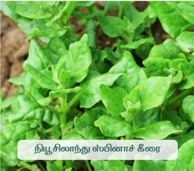
நியூசிலாந்து ஸ்பினாச் கீரை

கடல் மட்டத்திலிருந்து 800 முதல் 2500 மீட்டர் வரை சாகுபடி செய்ய இந்த இரகம் ஏற்றது. அமிலத்தன்மை பி.எச். 3.5 முதல் 6 கொண்ட மண்ணிலும் வளரும் தன்மை கொண்டு. பயிர்க் காலமான 135 நாட்களில் எக்டருக்கு 38 டன் கீரை விளைச்சல் கொடுக்க வல்லது. இலைகளில் அதிக