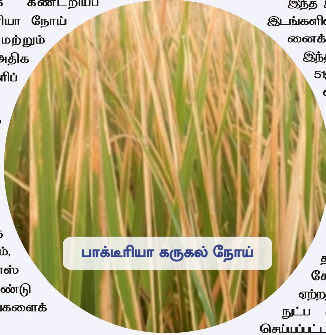
பாக்டீரியா கருகல் நோய்

ஆடுதுறை 55 நெல் இரகம் அதிக விளைச்சல் (5929 கிலோ / எக்டர், ஆடுதுறை 43 விட 10.0 விகிதம்), பாக்டீரியா கருகல் நோய்க்கு அதிக எதிர்ப்புத் திறனுடன் சிறந்த சமையல் பண்புகளையும் உடையது. தமிழகத்தில் கார் குறுவை மற்றும் கோடையில் சாகுபடி செய்வதற்கு ஏற்றதாக இருக்கிறது. உயர்த்தொழில் நுட்ப முறையின் மூலம் தேர்வு செய்யப்பட்ட இந்த இரகம் விவசாயிகள் பயிரிடுவதற்காக 2021 ம் ஆண்டு தமிழ்நாடு வேளாண்மைப் பல்கலைக் கழகத்தால் வெளியிடப்பட்டது.