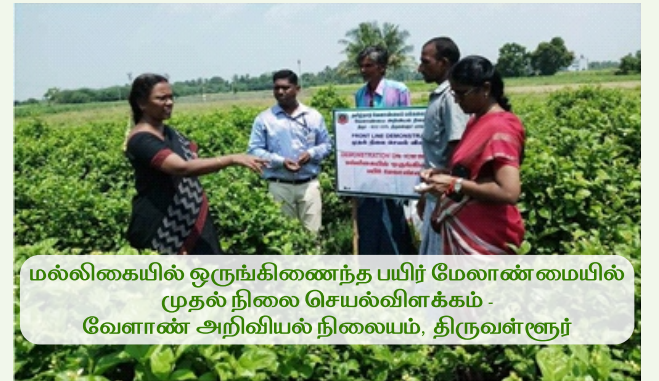
மல்லிகையில் ஒருங்கிணைந்த பயிர் மேலாண்மையில் முதல் நிலை செயல்விளக்கம் - வேளாண் அறிவியல் நிலையம், திருவள்ளூர்

உழவர்களின் வயல்களில் அமைக்கப்பட்டு அவற்றின் வெற்றியினை வானொலி, தொலைக் காட்சி, நாளிதழ்களின் மூலம் பெரும்பான்மையான மக்களைச் சென்றடைய வழிவகைச் செய்யப்படுகிறது. உதாரணமாக, சமீபத்தில் வெளியிடப்பட்ட