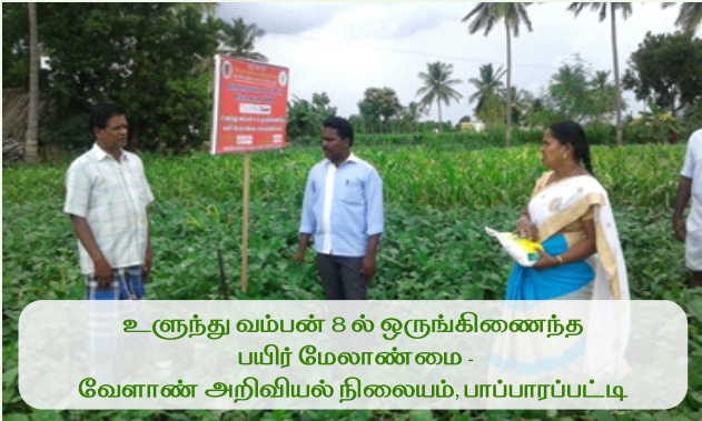
உளுந்து வம்பன் 8 ல் ஒருங்கிணைந்த பயிர் மேலாண்மை - வேளாண் அறிவியல் நிலையம், பாப்பார்பட்டி

திறன் மேம்பாட்டுப் பயிற்சிகள் வேளாண் அறிவியல் நிலையங்களில் நடத்தப்படுகின்றன.