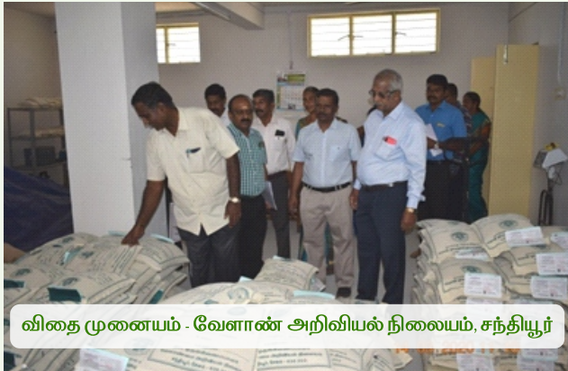
விதை முனையம் - வேளாண் அறிவியல் நிலையம், சந்தியூர்

தமிழ்நாட்டில் சேலம், திண்டிவனம், திருச்சி, விருதுநகர் மற்றும் மதுரை ஆகிய மாவட்டங்களில் செயல்படும் வேளாண் அறிவியல் நிலையங்களில், பயறுவகைப் பயிர்களில் விதை உற்பத்தித் திட்டம்