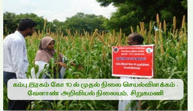
கம்பு இரகம் கோ 10 ல் முதல் நிலை செயல்விளக்கம் - வேளாண் அறிவியல் நிலையம், சிறுகமணி

விவசாயிகள் எளிய முறையில் புதிய பயிர் இரகங்கள் மற்றும் நவீனத் தொழில்நுட்பங்கள் பற்றி தெரிந்துக்கொள்ளவும், அவற்றின் உற்பத்தித் திறனை நேரடியாக அறிந்து கொள்ளவும், முதல்நிலை செயல்விளக்கத் திடல்கள் விஞ்ஞானிகளின் நேரடிப் பார்வையின் கீழ்